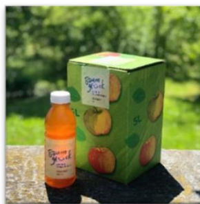
Fotos: MBF beim Hochstamm-Äpfel ernten und der verarbeitete Hochstamm-Süssmost